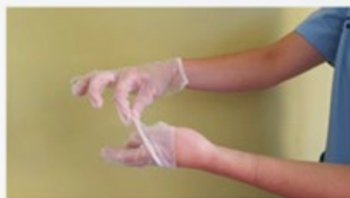
Retirar sin tocar la parte interior del guante