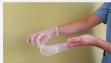
Retirar el guante en su totalidad