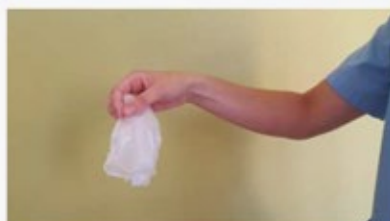
Retirar los dos guantes en el contenedor adecuado