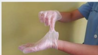
Pellizcar por el exterior del primer guante

Es importante retirarse los guantes de forma correcta para que no exista una posible contaminación del elemento hacia el trabajador, a continuación se indica la técnica de como quitarlos: