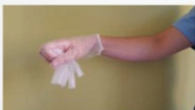
Recoger el primer guante con la otra mano