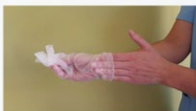
Retirar el segundo guante introduciendo los dedos por el interior